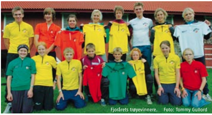
Fjorårets trøyevinnere.